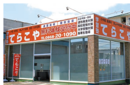
高野教室 住/津山市高野本郷1266-1