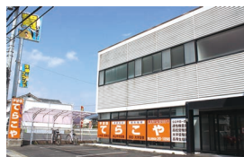
北園第一教室 住/津山市北園町9-13