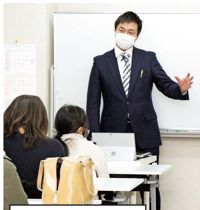
津山中学受験対策セミナー

学生や就職した後の若い方は、自分を知る自己分析が大切です。また、個人主義が加速し、共働きが当たり前になり、子育てに疲れ切っている家庭も多くあります。そういった方々の相談者になる「大人対象のキャリア教育」で、大人も成長出来る環境をつくり、地域の発展に貢献出来ればと思っています。