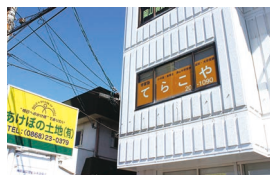
北園第二教室 住/津山市北園町8-4 あけぼのビル2F